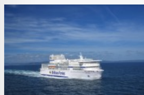
Le Pont-Aven Télécharger

Compagnie française. 1er employeur de marins français. Entre 2 400 et 3 100 collaborateurs selon la saisonnalité (dont 2000 marins). Chiffre d'affaires : 469 millions d'euros/an. 2,49 millions de passagers dont 85% de Britanniques. 866 000 voitures. 202 000 camions. 6 000 emplois indirects. 12 navires. 12 routes maritimes desservies entre la France, le Royaume Uni, l'Irlande et l'Espagne. 12 ports : Roscoff, Saint-Malo, Cherbourg, Caen-Ouistreham, Le Havre, Plymouth, Poole, Portsmouth, Cork, Rosslare, Santander, Bilbao.