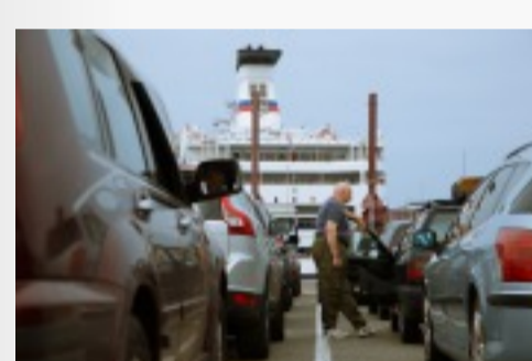
Embarquement des véhicules Télécharger