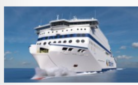
Le Honfleur, le futur navire GNL de Brittany Télécharger