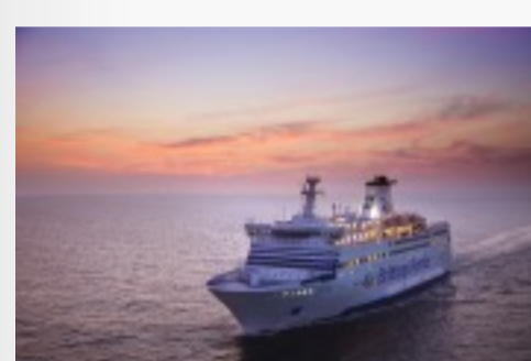
Le navire Le Bretagne de Brittany Ferries Télécharger