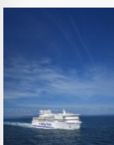
Le navire Pont-Aven de Brittany Ferries Télécharger