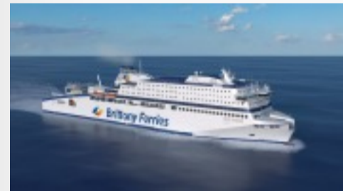
Le Honfleur, le futur navire GNL de Brittany Télécharger