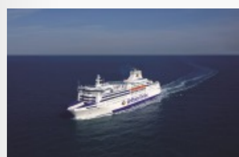
Le navire le Normandie de Brittany Ferries Télécharger