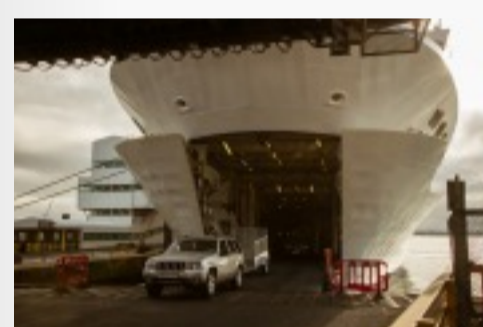
Sortie des véhicules Télécharger