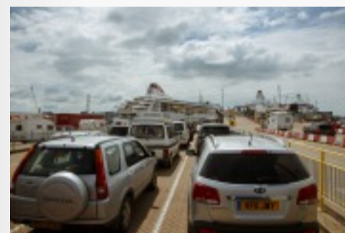
Brittany Ferries Télécharger