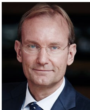
Niels SMEDEGAARD ECSA President

ECSA launched the shipping week in 2015 in order to make shipping more visible and better known by the European institutions. The second shipping week was held from feb. 27 to march 3 2017. How do you assess this initiative, and how has it evolved?